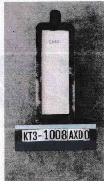
Sau khi thử/ After testing