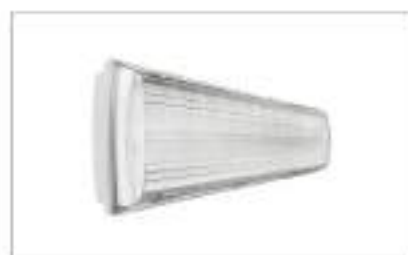
Đèn khẩn cấp