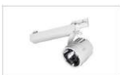
Đèn trong nhà