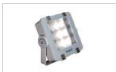
Đèn ngoài trời