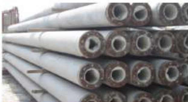
Sản xuất trụ bê tông ly tâm thường