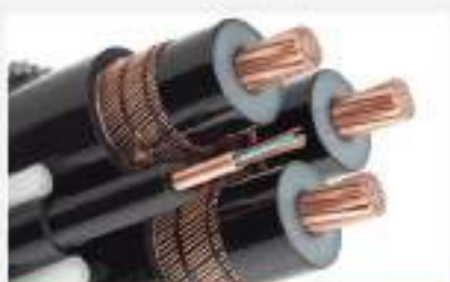
Dây dẫn điện, cáp điện