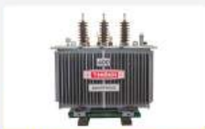
Máy biến áp phân phối