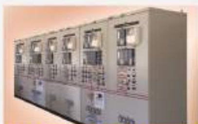
Tủ điều khiển, bảo vệ TBA 110kV