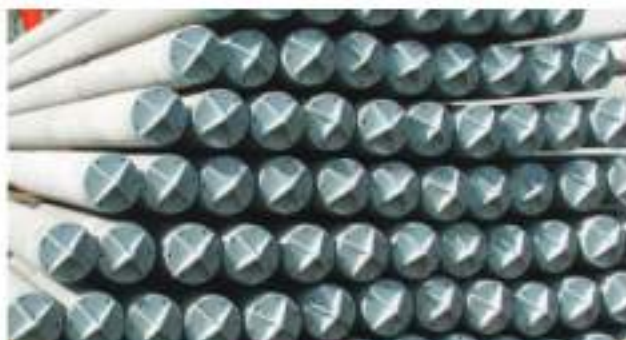
Sản xuất trụ bê tông ly tâm dự ứng lực