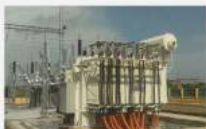
Máy biến áp 110kV