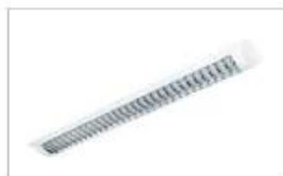
Đèn Led ốp trần