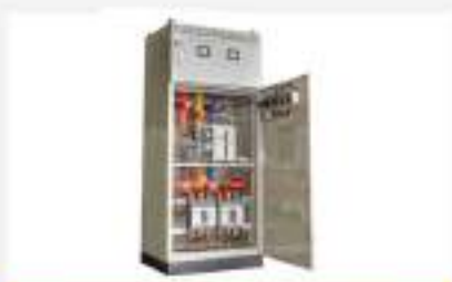
Tủ điện trung, hạ thế