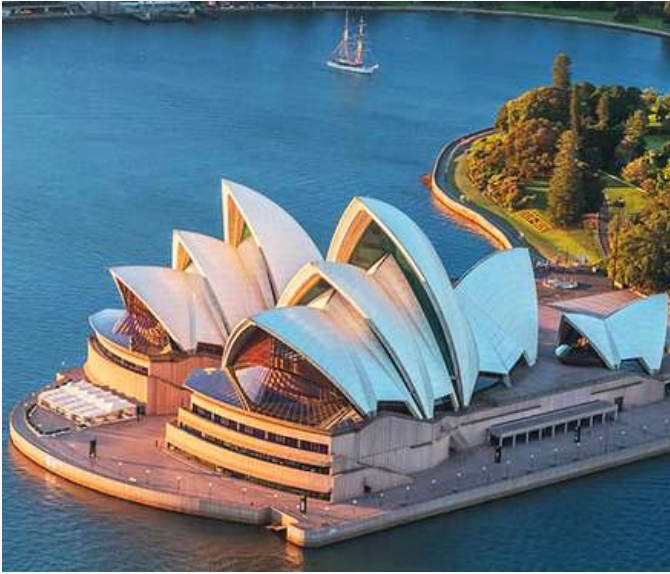
TOUR ÚC SYDNEY - MELBOURNE