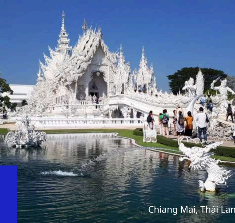
Chiang Mai, Thái Lan