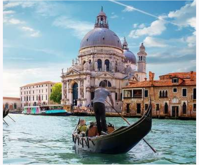
TOUR CHÂU ÂU PHÁP - HÀ LAN - Ý - THỤY SĨ